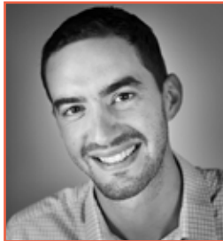
Table ronde 1 - Quels leviers collectifs pour une meilleure qualité de l'air dans les métropoles sont-ils mobilisables ?